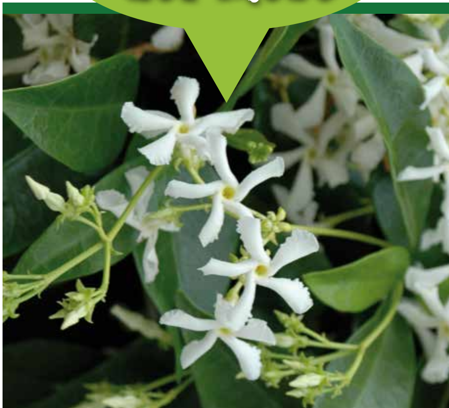
Falso gelsomino Trachelospermum jasminoides

Come e perché scegliere il falso gelsomino