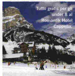
Tutto gratis per gli under 8 al Romantik Hotel Cappella.

1 Al Romantik Hotel Cappella di Colfosco (Bz) , dal 20 marzo al 10 aprile prenotando una vacanza di una settimana, i bambini fino a 8 anni in camera con i genitori soggiornano e sciano gratis ( hotelcappella.com ).