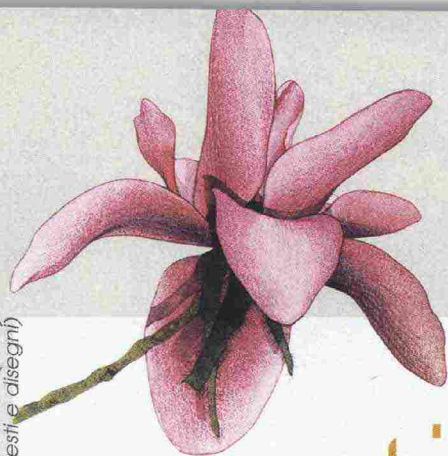
a cura di Andrea Bianchi (testi) e Cecilia Marra (testi e disegni)