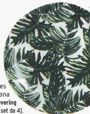
Piatto Leaves in porcellana [&Klevering €35 il set da 4].

[Stefano Mancuso Plant revolution Giunti €20 pp. 264]. Lo sapevate? Le piante sono 'reti viventi' in grado di sopravvivere alle catastrofi: non potendo fuggire, hanno sviluppato la capacità di resistere; sono organismi sofisticati più moderni degli animali; hanno una struttura solida e flessibile che ispira l'architettura e dà spunti alla robotica. Studiare le piante può migliorare il nostro futuro. Il neurobiologo vegetale Stefano Mancuso ne è convinto, e in questo libro affascinante ci mostra il mondo verde - di cui anche in casa non possiamo fare a meno - come non lo abbiamo mai visto.