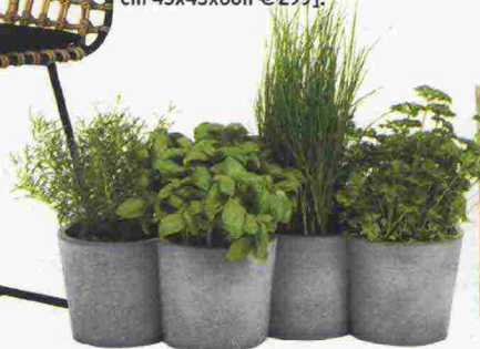
Multivaso in calcestruzzo Potpot [Kostantin Slawinski, cm 48,5x19,8x12,2 €79,90].