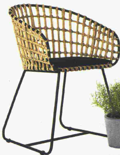
In rattan la poltrona Tokyo [Pols Potten, cm 45x43x68h €299].

[Stefano Mancuso Plant revolution Giunti €20 pp. 264]. Lo sapevate? Le piante sono 'reti viventi' in grado di sopravvivere alle catastrofi: non potendo fuggire, hanno sviluppato la capacità di resistere; sono organismi sofisticati più moderni degli animali; hanno una struttura solida e flessibile che ispira l'architettura e dà spunti alla robotica. Studiare le piante può migliorare il nostro futuro. Il neurobiologo vegetale Stefano Mancuso ne è convinto, e in questo libro affascinante ci mostra il mondo verde - di cui anche in casa non possiamo fare a meno - come non lo abbiamo mai visto.