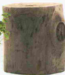
Tavolino Ceppo ricavato da un tronco di rovere [Alf DaFrè, cm ø cm 30x37 €166].

NEL PROSSIMO NUMERO ● Volete visitare la casa che abbiamo allestito per il Fuorisalone? Accomodatevi! Qui ne sveliamo i segreti décor! ● Outdoor da vivere: tende, gazebi, mobili da esterni, tutto quello che cerchi per arredare il tuo angolo all'aperto. ● Ispirazioni: dall'Olanda alla Puglia, tante idee da rubare alle case di charme.