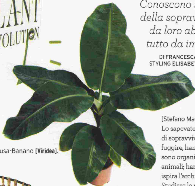
Pianta Musa-Banano [Viridea].