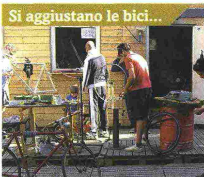
Si aggiustano le bici... NELLA 'CICLOFFICINA' , un vero e proprio laboratorio aperto dove scambiare saperi ed esperienze, diffondere la cultura del riciclo creativo e imparare a riparare in autonomia la propria bici.