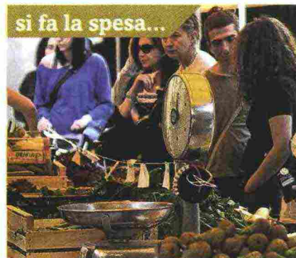
si fa la spesa... AL MERCATO AGRICOLO a filiera corta, dove si trovano prodotti freschi e biologici, di stagione, direttamente da produttori e artigiani del territorio. La qualità è sicura, il prezzo giusto!