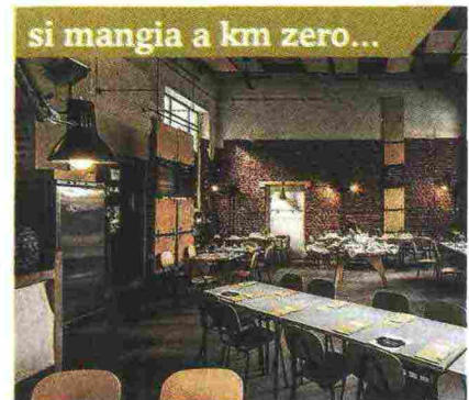
si mangia a km zero... A 'UN POSTO A MILANO' , dove le ricette sono basate su prodotti e risorse stagionali legati al territorio, a km zero, o quasi, e tutti rintracciabili. E dove pane, pasta e dolci... sono fatti davvero in casa!