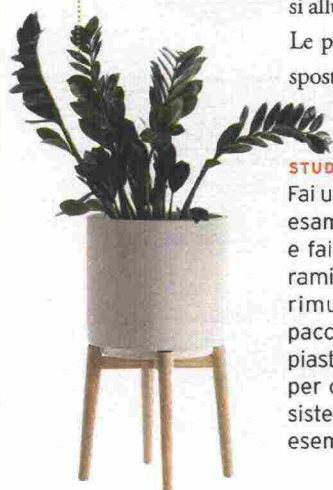
Portapiante Florian [La Redoute, Ø cm 37x42h € 73].

Febbraio è uno dei mesi migliori per intervenire sulla struttura del giardino: le giornate si allungano, il rischio di gelate si allontana e la primavera non sembra più così lontana. Le piante, però, sono ancora dormienti e questo ci consente di ultimare potature e spostamenti e di effettuare già alcuni lavori importanti.