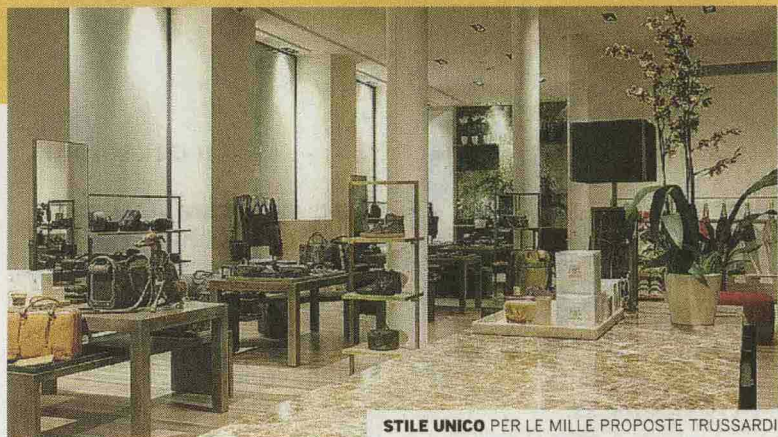
STILE UNICO PER LE MILLE PROPOSTE TRUSSARDI