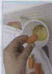
Giochi con "Bambini in cucina"

■ L'opera per i più piccoli . Il progetto di Aslico - che ha una storia iniziata ormai quindici anni fa - si arricchisce quest'anno di nuove proposte per coinvolgere anche i più piccoli: il percorso didattico parte nelle scuole (vengono utilizzati anche strumenti multimediali) e continua poi in teatro. Lo scopo è quello di mettere in moto l'interesse e la curiosità dei bambini e dei ragazzi nei confronti della lirica. Le iscrizioni ai progetti sono già aperte. Gli spettacoli ( Nabucco , Nabuccolo , Viva Verdi , L'Eroica ) vanno in scena al Teatro Sociale di Como e agli Arcimboldi, a Milano. Info per scuole e famiglie: 0289697360.