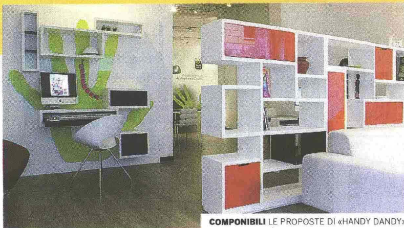
COMPONIBILI LE PROPOSTE DI «HANDY DANDY»